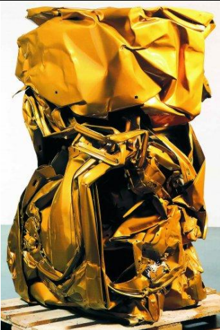
Giallo Naxos 594 1998

César travaillera aussi des « compressions » et des « expansions »