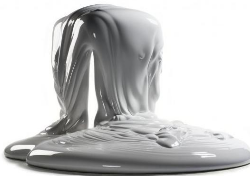
Expansion No 37 1972