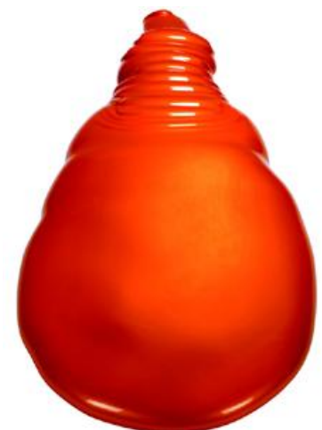
Expansion No 4 1969