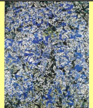
A-P ARNAL Pliage 1973, Froissage 1969