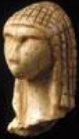
Le plus ancien visage connu Ivoire de mamouth Vers 21 000 av J.C H : 3,65cm