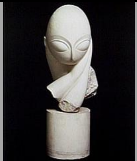
Constantin Brancusi Melle Pogany 1912