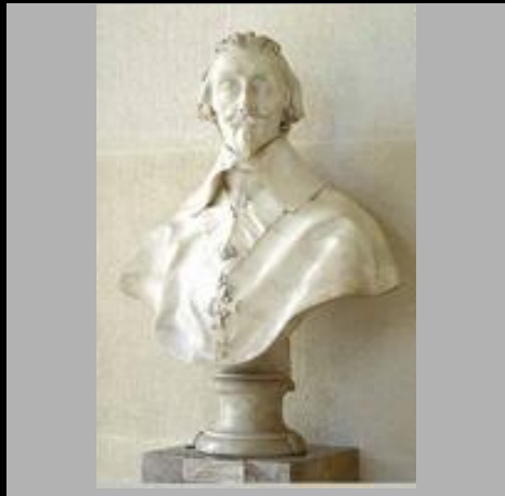
le BERNIN Le Cardinal de Richelieu (buste, marbre, 1641)