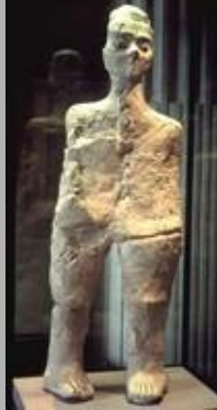
Une œuvre néolithique d'un mètre de haut Statue de Aïn Ghazal , Jordanie Plâtre de gypse à l'origine sur structure végétale, 1m, Néolithique vers 7500 av. J.-C.