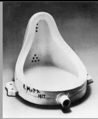
Marcel Duchamp 1917 Fontaine