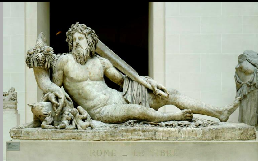
ROME - LE TIBRE