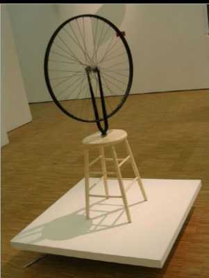
Marcel Duchamp 1913 Roue de bicyclette