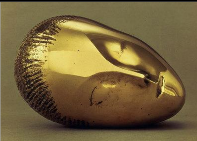
Constantin Brancusi Muse endormie 1910