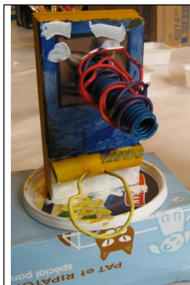
Un travail de GS en cours de réalisation.