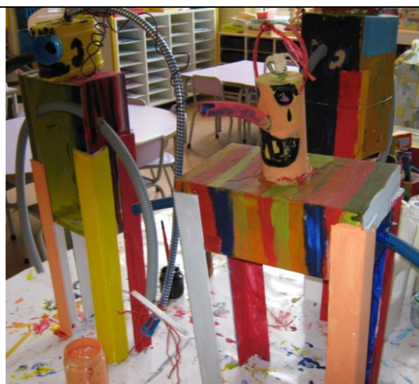
Un travail de GS en cours de réalisation.