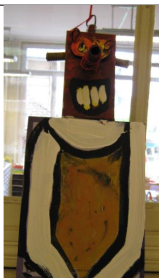
Un travail de GS en cours de réalisation.